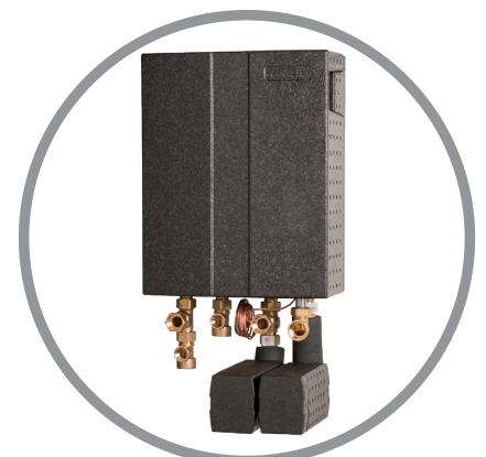
Termix VMTD Mini m/påbygget fordelerrør

Bemærk: Overholder kravene i DS452 til isolering.