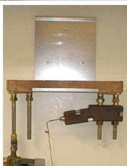
Vægbeslag til Termix VMTD