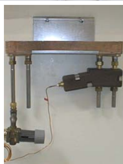
Vægbeslag til T20 solo